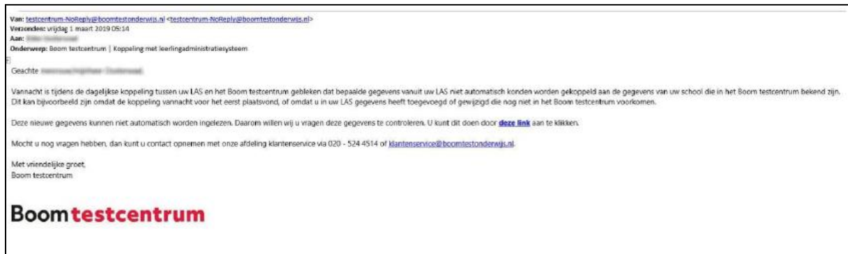
Afbeelding 3: mail voor beheerder.