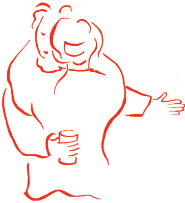
De jeugd is al met al vrij conservatief over seks

te vrijen, is 'om dicht bij elkaar te zijn' en 'dat wil je als je veel voor elkaar voelt'. Dat motief geldt zowel voor zeventig procent van elf- tot dertienjarige jongens als voor 92 procent van de zestien- tot zeventienjarige meisjes. De ervaring begint al jong. De eerste keer tongzoenen doet 64 procent als