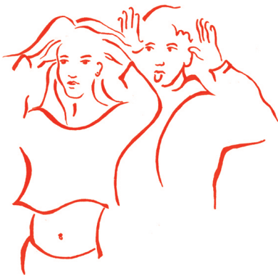
Kindvrouwtjes en mannetjeskinden samen in één klas

langer dan twaalfjarige jongens en zijn ze in de eerste klassen van het voortgezet onderwijs in het algemeen wat betreft de seksuele rijping zo'n twee jaar voor op de jongens. Dat alles bij elkaar vraagt van leraren een speciale vaardigheid om enerzijds toch een zekere eenheid te bewaren en anderzijds alle leerlingen in de specifieke fase van ontwikkeling tot hun recht te laten komen. Als dat niet lukt, kan een leerling zich onzeker en ongelukkig voelen.