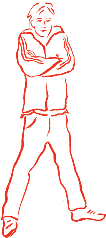
Geen raad weten met je slungelige lijf

De gevolgen van dit ‘mannelijk’ worden van jongensgedrag worden in diverse hoofdstukken besproken.