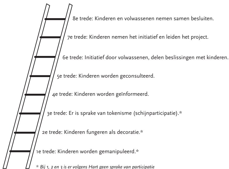
Figuur 1.1. De kinderparticipatieladder van Hart (1992)

Het model van Hart heeft veel navolging gekregen in de praktijk. Zijn participatieladder illustreert de verschillende niveaus van initiatief en van samenwerking die kinderen en jongeren kunnen hebben in projecten met volwassenen. Net als Arnstein onderscheidt hij acht niveaus, waarbij de onderste drie niveaus 'non-participatie' illustreren. Veel onderzoekers zijn geneigd deze laagste niveaus te schrappen omdat ze in hun analyse niet op zoek zijn naar vormen van non-participatief onderzoek. Toch zijn deze niveaus van non-participatie wel belangrijk. Ten eerste kan niemand op voorhand uitsluiten dat een van deze vormen geen onderdeel uitmaakt van het onderzoeksproces en dan is het belangrijk om dit te (h)erkennen. En ten tweede, slechts wanneer we in staat zijn om vormen van non-participatie te kunnen (h)erkennen, kunnen we ook op zoek gaan naar de onderliggende mechanismen van die non-participatie. Of te wel op zoek te gaan naar de vraag waarom het ondanks goede bedoelingen, niet altijd lukt om participatie in en door onderzoek te realiseren. Het begrijpen van de mechanismen die daaraan ten grondslag liggen, kan helpen om wegen te vinden waardoor de participatie van kinderen en jongeren vervolgens beter tot zijn recht kan komen.